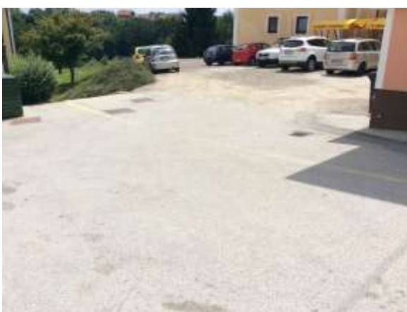
Parkirišče pri šoli ob Domu kulture