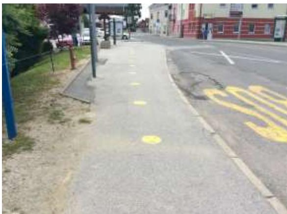
Avtobusno postajališče ob šoli