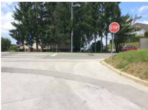
Prehod za pešce z avtobusne postaje proti šoli