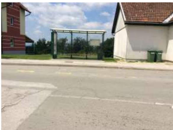
Avtobusna postaja pri trgovini Merkator