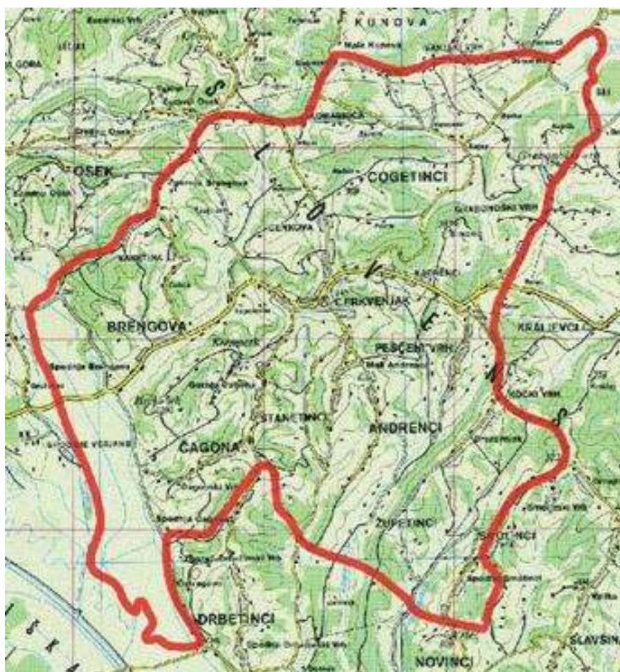
Šolski okoliš občine Cerkvenjak

Otrok naj gre v šolo pravočasno, ob tem pa upošteva vsa predpisana pravila o ravnanju udeležencev v prometu. Še posebej pa moramo biti pozorni na otroke, ki šele spoznavajo življenje in delo šole.