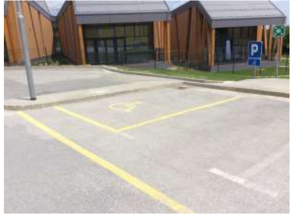
Parkirišče ob vrtcu pri šoli z označbami za prepovedano ali rezervirano parkiranje