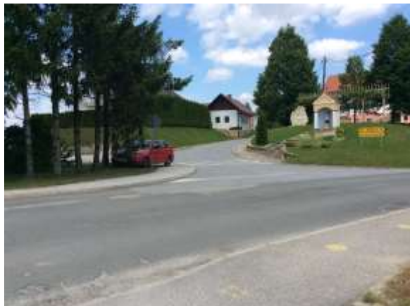
Križišče in prehod za pešce proti Cenkovi