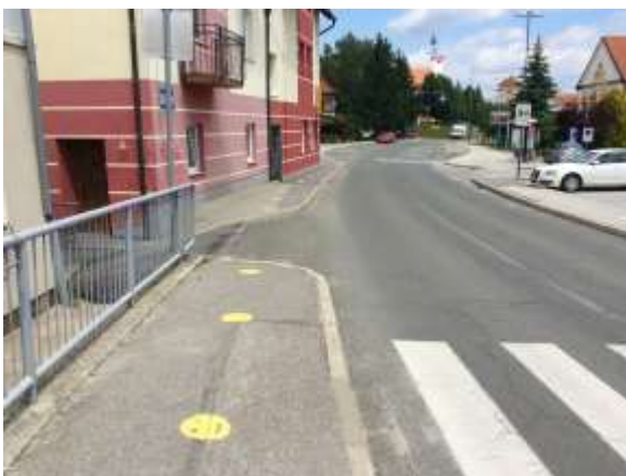
Označena pot za pešce na pločniku in prehod za pešce proti Domu kulture