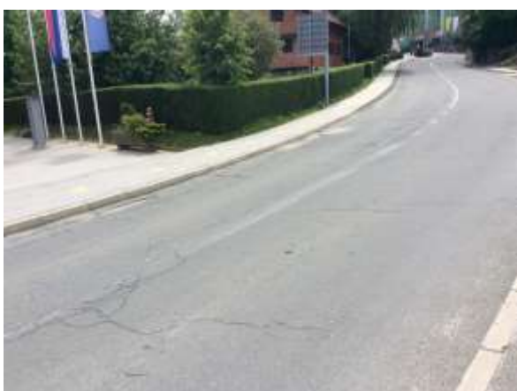
Označena pot za pešce v smeri proti cerkvi Sv. Antona