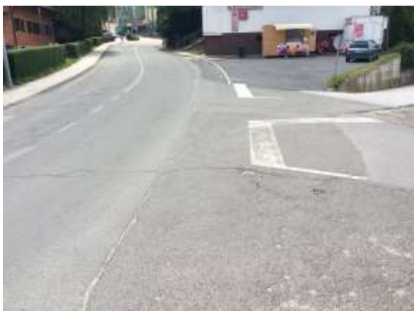
Del poti brez pločnika na poti iz Cerkvenjaka