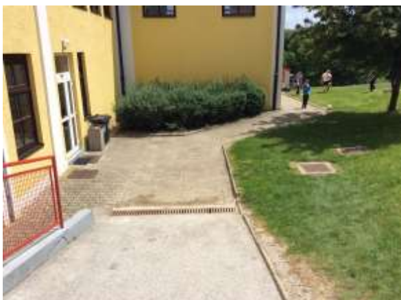
Urejene poti okrog šole