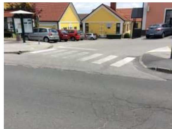
Dovozna pot k šoli in prehod za pešce