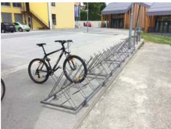
Parkirišče za avtomobile in kolesarje pod šolo